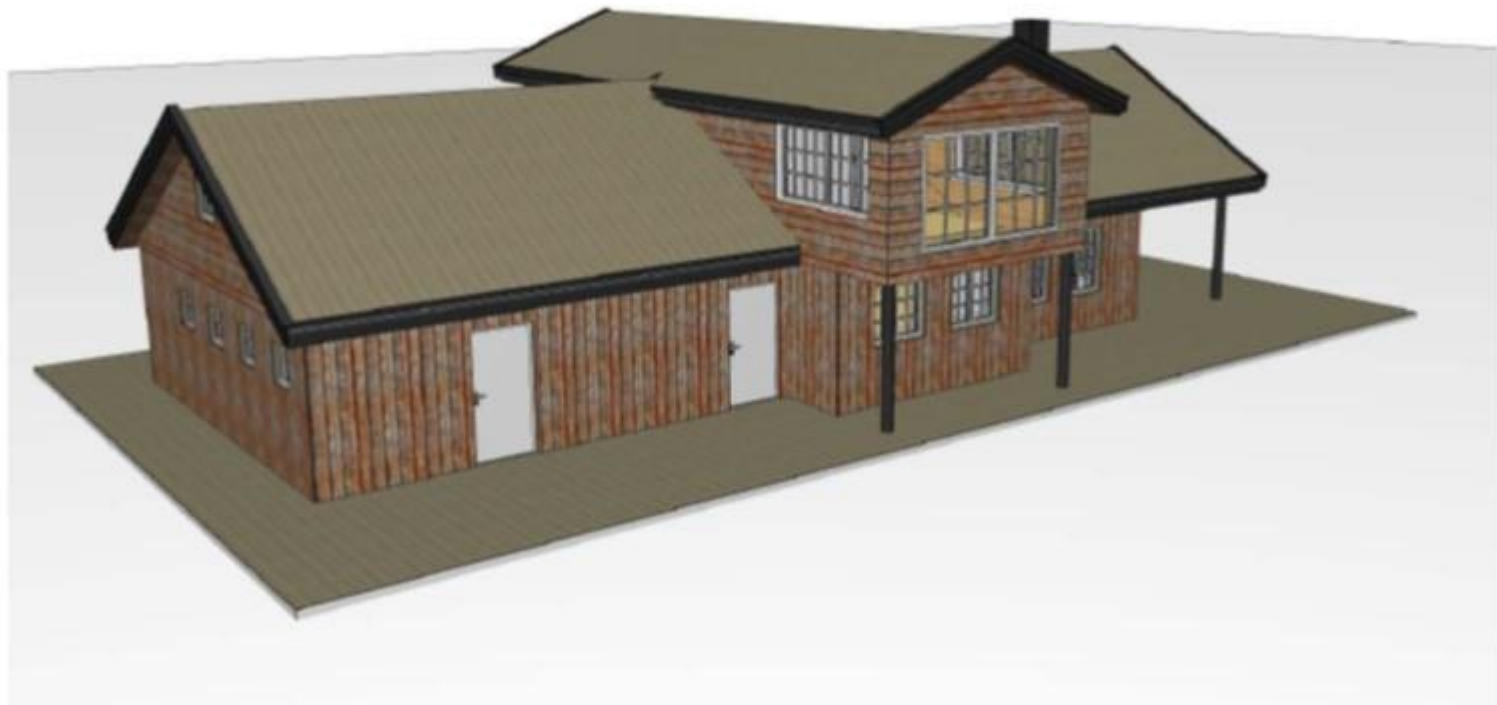
Utvendig tegning av ny skistue/målhus – sett vestfra