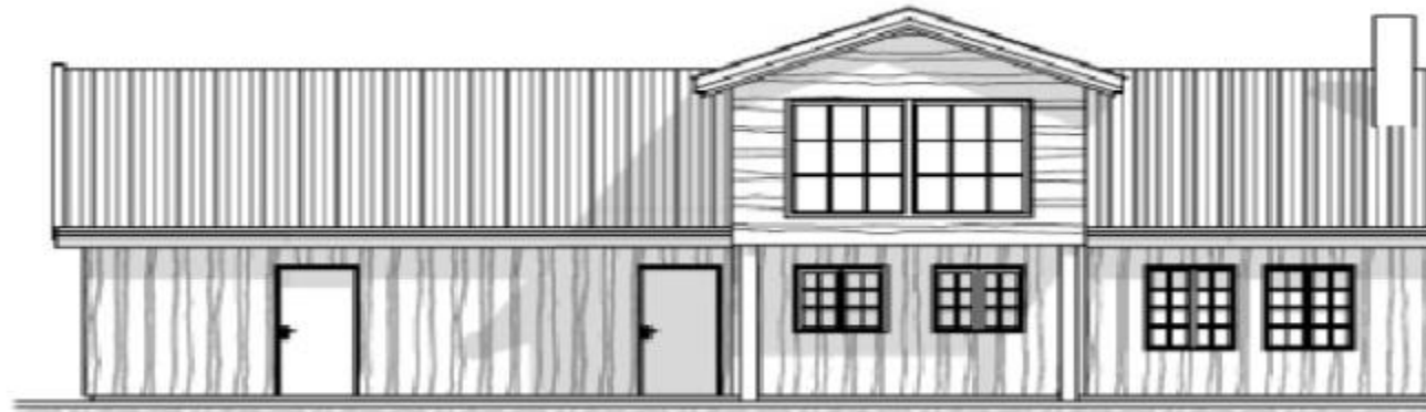
Fasade - vest