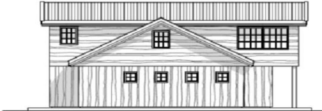
Fasade - nord